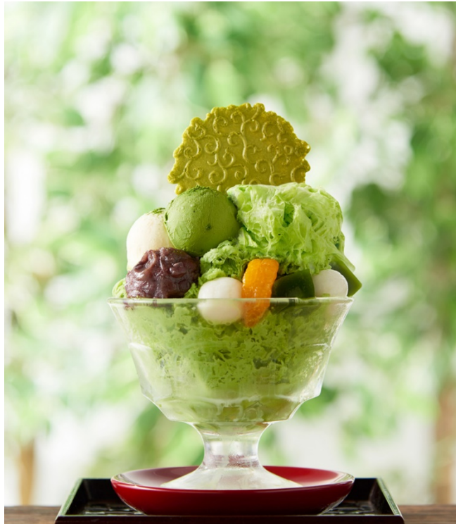
宇治抹茶パフェ氷