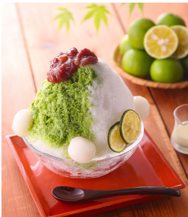
宇治抹茶すだち氷

エをかき氷に見立て、味つき氷を削った『宇治抹茶パフェ氷』含め、お茶屋だからこそできる5種の「宇治抹茶×かき氷」をお楽しみください。