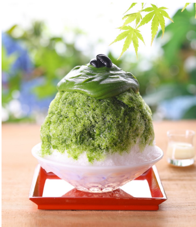
宇治抹茶だいふく氷