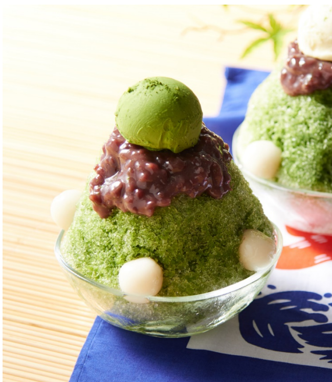
昔懐かし宇治金時