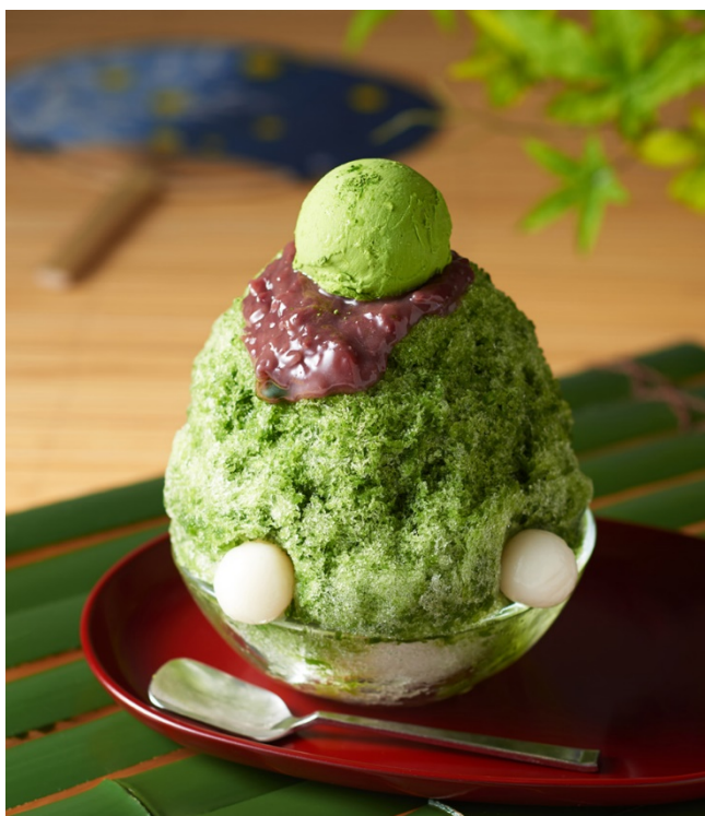
ふわふわ宇治金時