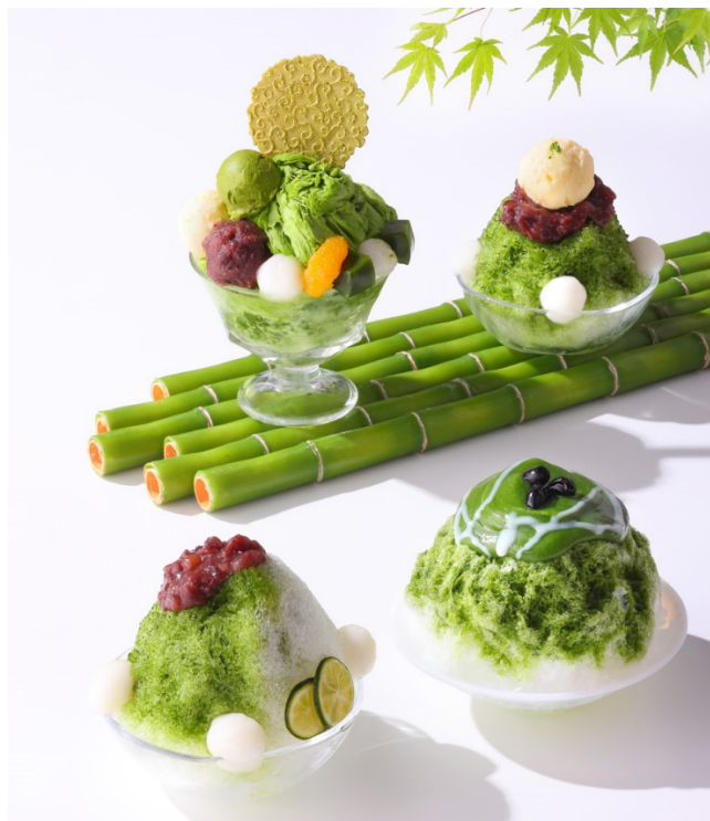
伊藤久右衛門 宇治抹茶氷まつり 2021