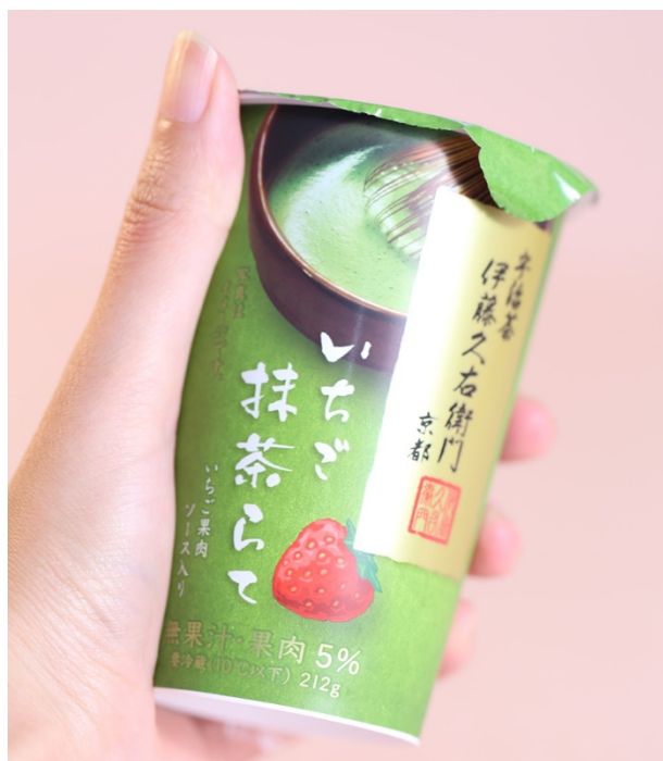
伊藤久右衛門監修 いちご抹茶らて 212g パッケージ