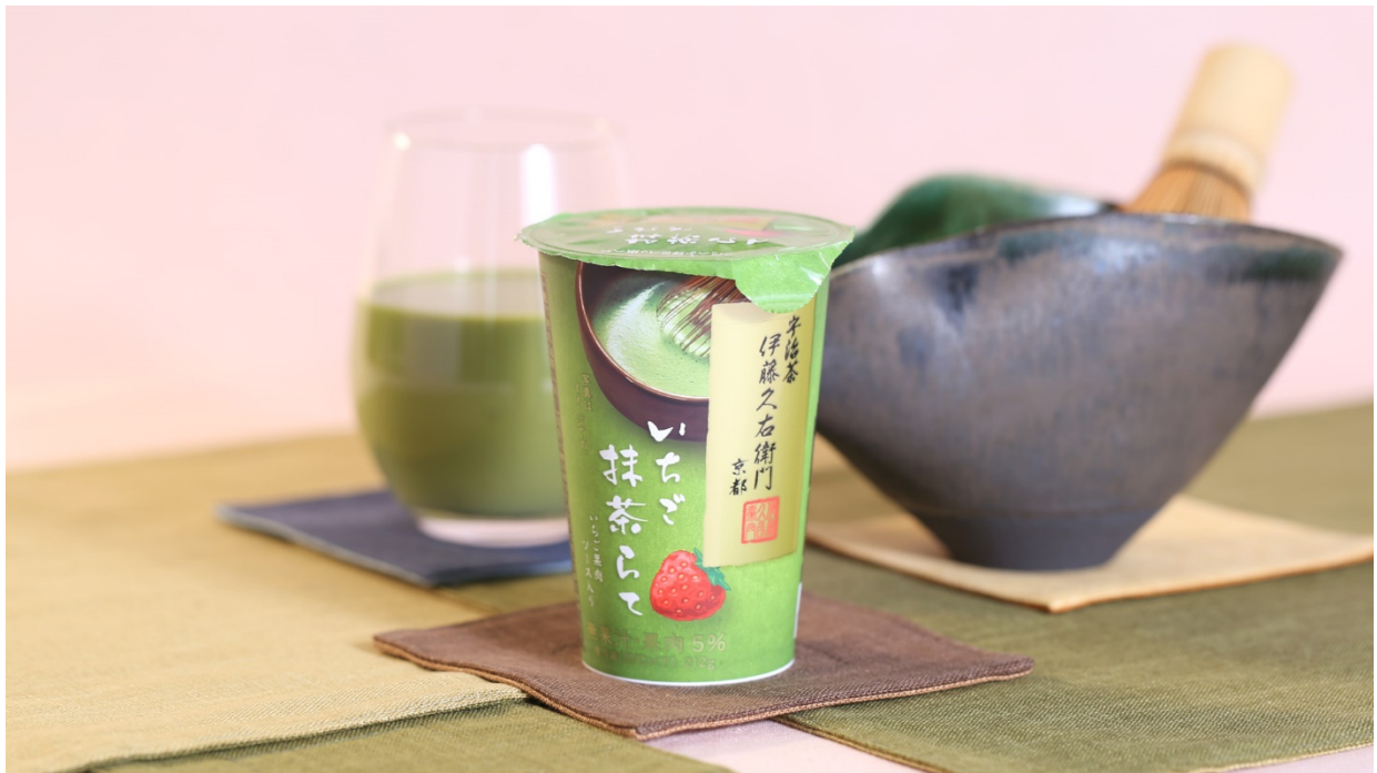
伊藤久右衛門監修 いちご抹茶らて 212g