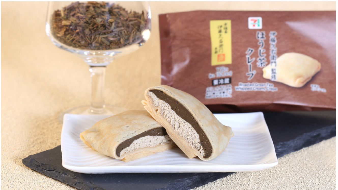
伊藤久右衛門監修 ほうじ茶クレープ

「ほうじ茶クレープ」は、ほうじ茶クリームとほうじ茶ホイップクリーム、層を2段構えにし、クレープ生地で包みました。ほうじ茶クリームにミルクチョコを入れることで、軽い口当たりのなかにもコクを感じる味わいに仕上げました。