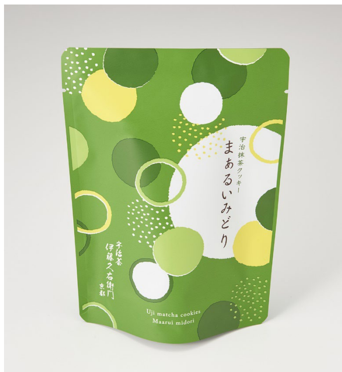
宇治抹茶クッキー まあるいみどりパッケージ