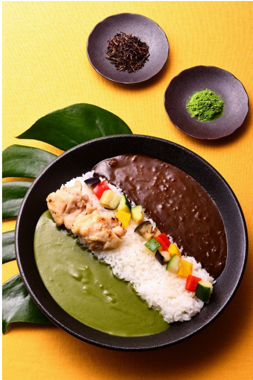
宇治抹茶&宇治ほうじ茶 あいがけカレー