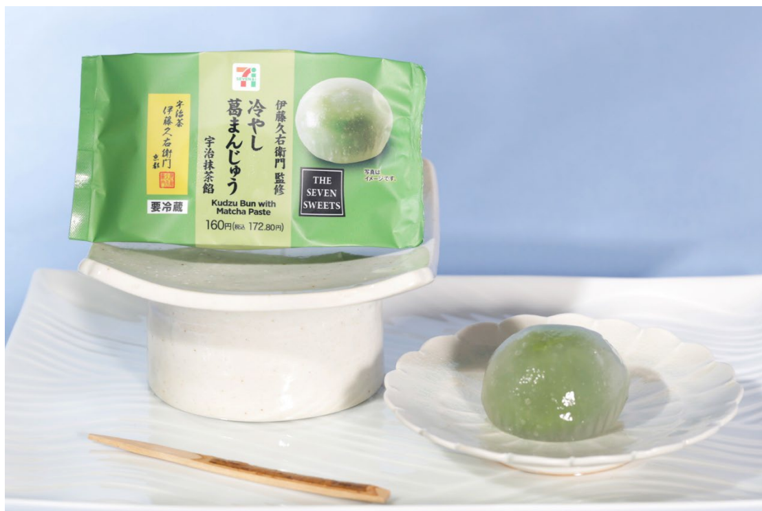
伊藤久右衛門監修 冷やし葛まんじゅう 宇治抹茶餡