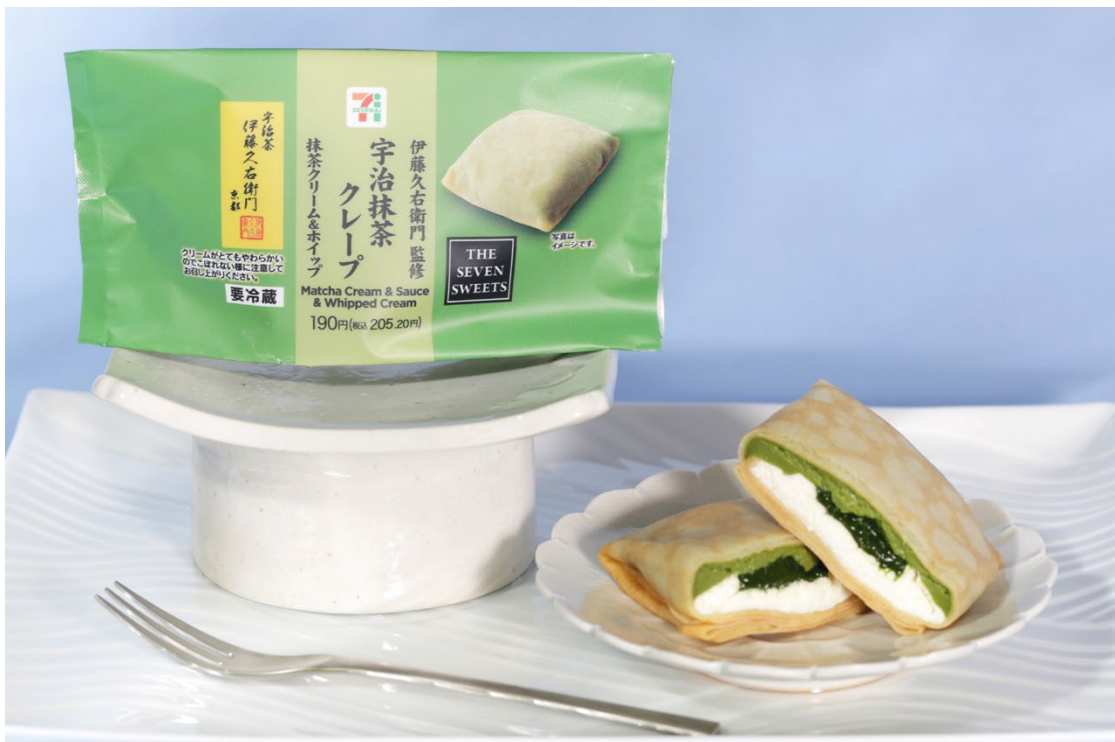
伊藤久右衛門監修 宇治抹茶クレープ