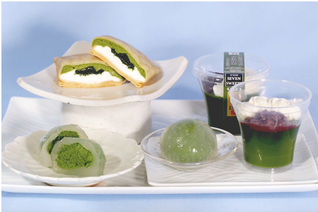
伊藤久右衛門監修 宇治抹茶スイーツ 3種