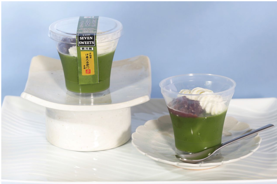
伊藤久右衛門監修 宇治抹茶 くずねり仕立て