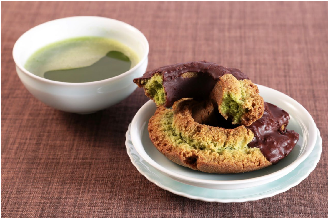
伊藤久右衛門監修 オールドファッション宇治抹茶