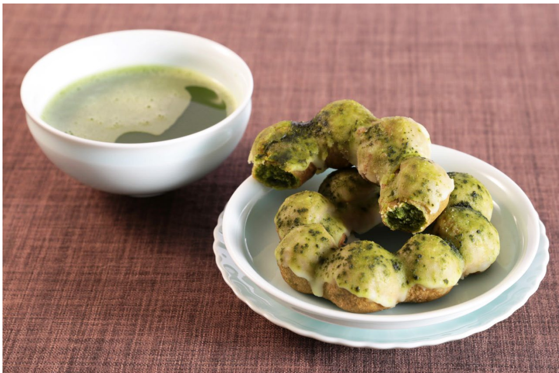
伊藤久右衛門監修 もちもちリング宇治抹茶