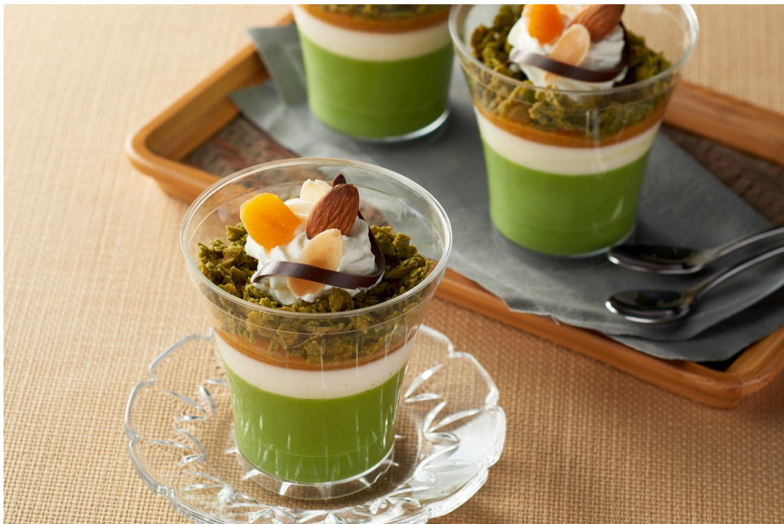
宇治抹茶とアーモンドミルクのブランマンジェ

https://www.itohkyuemon.co.jp/site/almond-k/