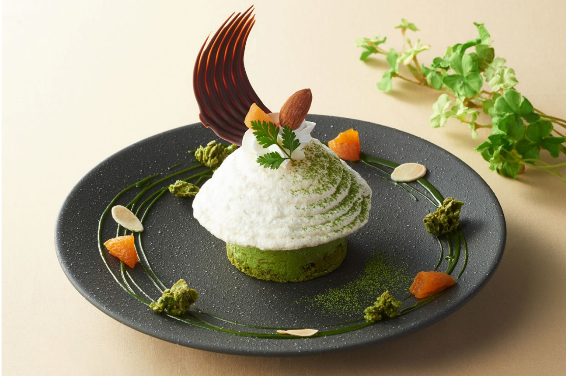
宇治抹茶アシェット・デセール ～アーモンドの惑星～

アーモンドミルクのクリーミーで優しい甘さと上質な抹茶の旨味が引き立つカレーうどんです。 JR 宇治駅前店茶房・祇園四条店茶房にて提供いたします。