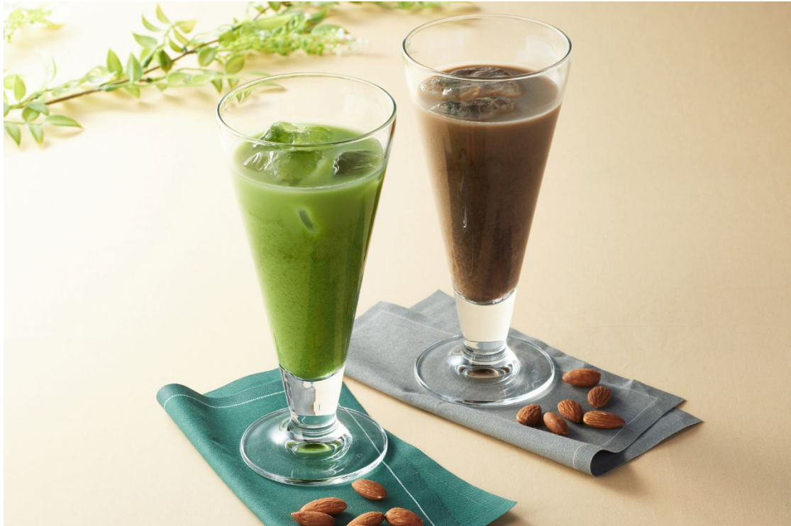
宇治抹茶&宇治ほうじ茶アーモンドミルクラテ

シンプルな構成ですが、ストレートにアーモンドミルクの華やかな香りとナッツのコクを感じられます。宇治抹茶、宇治ほうじ茶との相性もバッチリです。宇治本店茶房・JR 宇治駅前店茶房・祇園四条店茶房にて提供いたします。また、祇園四条店のみテイクアウトも承ります。