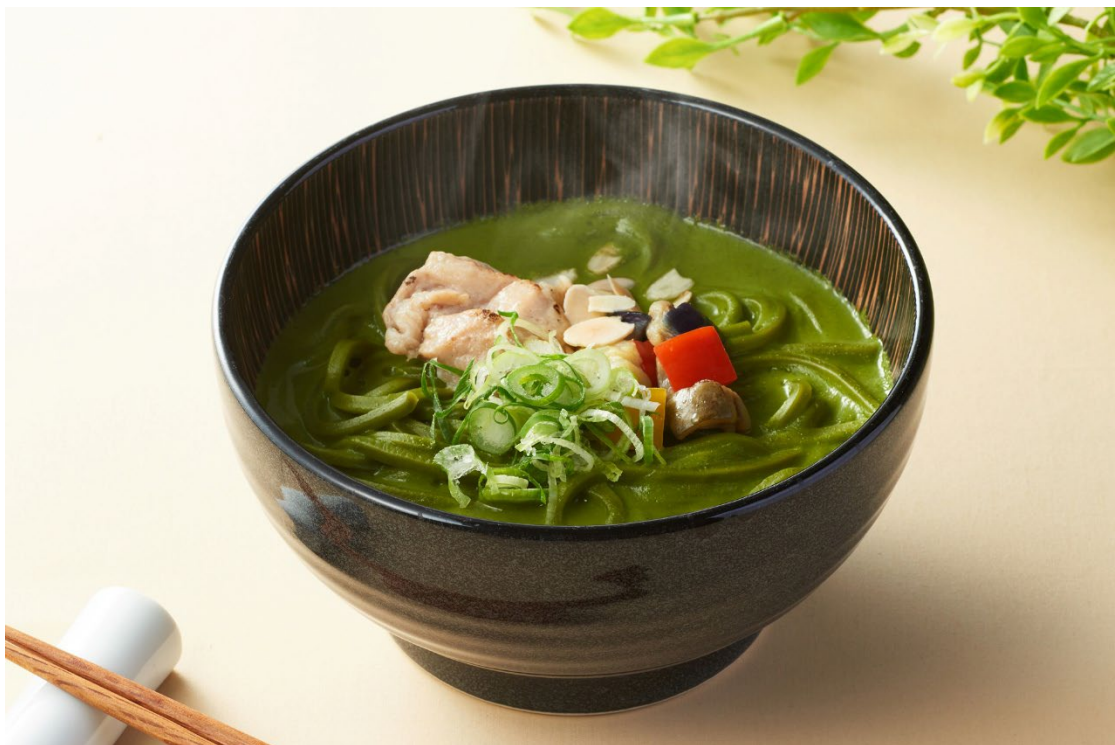
宇治抹茶とアーモンドミルクのクリーミーカレーうどん

シンプルな構成ですが、ストレートにアーモンドミルクの華やかな香りとナッツのコクを感じられます。宇治抹茶、宇治ほうじ茶との相性もバッチリです。宇治本店茶房・JR 宇治駅前店茶房・祇園四条店茶房にて提供いたします。また、祇園四条店のみテイクアウトも承ります。