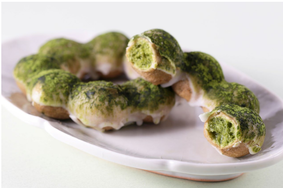
伊藤久右衛門監修 もちもちリング宇治抹茶