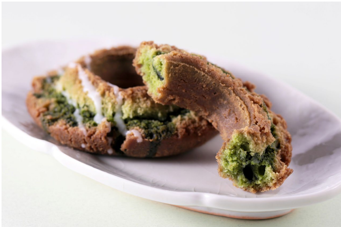
伊藤久右衛門監修 オールドファッション宇治抹茶