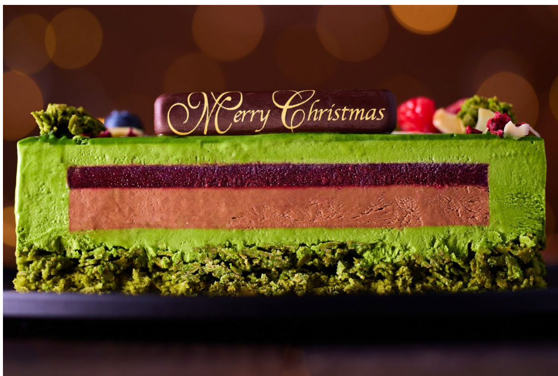
宇治抹茶ノエル ドゥーブル ショコラ断面

目をひくのは見た目だけでなく、その断面も。宇治抹茶チョコレートムースに包まれたケーキにナイフを入れると、カシスとラズベリーの甘酸っぱいジュレに、ベルギー産ダークチョコレートをを使用したムース、緑に囲われたシックな2層がお出迎え。土台のしっとりとした宇治抹茶スポンジの上には、ザクザクとした食感の宇治抹茶フィアンティーヌを忍ばせております。2種のチョコレートを存分に味わう、クリスマス限定の宇治抹茶チョコレートケーキです。