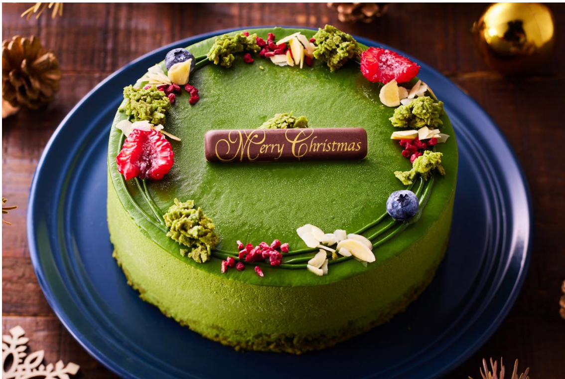
宇治抹茶ノエル ドゥーブル ショコラ